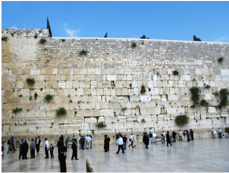
Ben Gurion ca. 150 km.